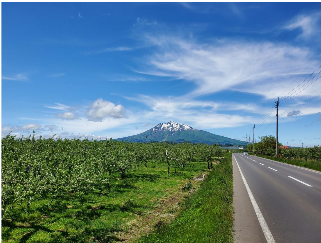
弘前市の岩木山の周りには広大なリンゴ畑が広がる