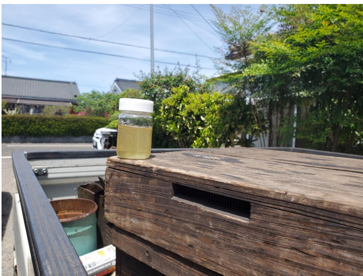
れんげの花の蜂蜜は色が白っぽくクセが少な目。今年は特に綺麗な色のれんげ蜂蜜が採れた