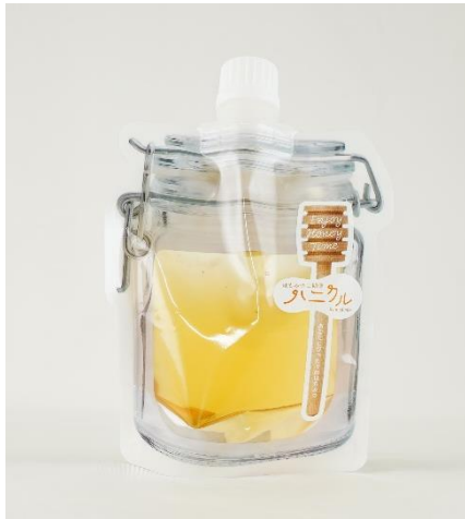
あなたにぴったりのはちみつイメージ