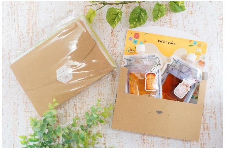
ポストに届くメール便イメージ