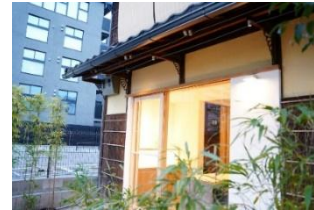
京都蜂蜜酒醸造所